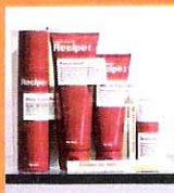
上:スウェーデンのコスメブランド「Recipe」。男性用基礎化粧品からシワ伸ばしクリーム、コンシーラーまで揃う。右:ラボのような店内。

未来的な雰囲気漂う店内では、スキンドクターと呼ばれるスタッフが肌の悩みなどの相談に乗ってくれて、基礎化粧品から最先端のケミカルコスメまで各人に最適な商品をセレクトしてくれる。男性でも気軽にお試し可能だ。化粧品のほか、バス用のエッセンシャルオイルやシャワージェルなども充実。このショップの登場で、きれいな男性がますます増えそうだ。