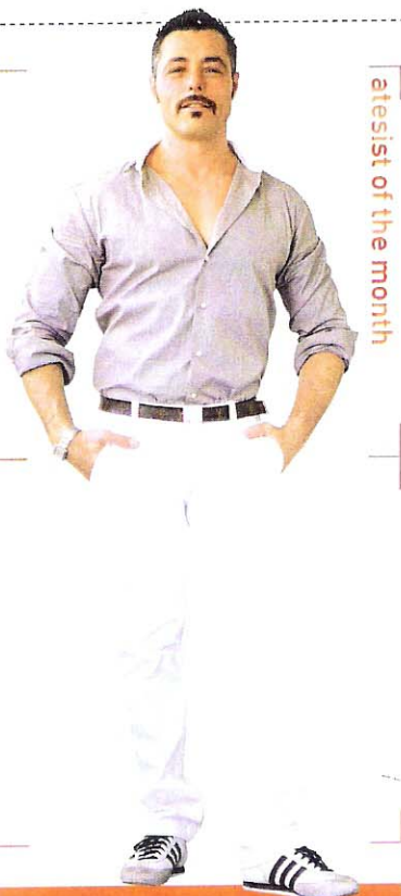
atesist of the month

SEVEN CASA DEI CILIEGI Via Luigi Bertelli 4 ☎02-2615190 M GORLA ☎19時～24時 ☎日 www.sevengroup.it