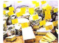
150種類以上のチーズが置かれたコーナー。選んだチーズはその場でカットして味わえる。好みのチーズを探す楽しみもひとしお。

左:320gのリブアイステーキ14.8ユーロ。肉質と量に感動だ。右:ミックスサラミ8.75ユーロ。オーナーが足で集めたサラミには季節限定品も。