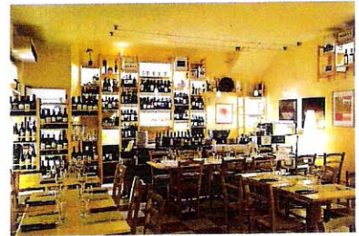
壁の棚に並ぶワイン。値段もかなりリーズナブルだ。